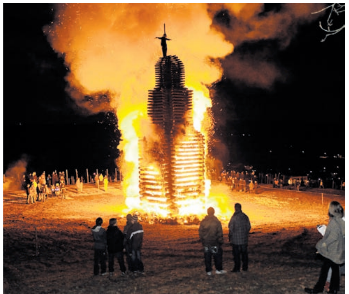
Es knistert und lodert prächtig: Zum Fasnachtsfeuer in Oberstammheim haben sich viele Besucher eingefunden.